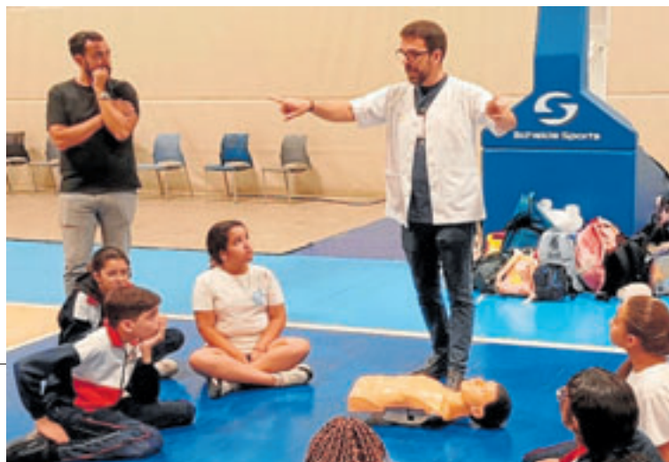
Un enfermero durante un taller de primeros auxilios. c7

El Consejo Internacional de Enfermeras (CIE) ha elegido como