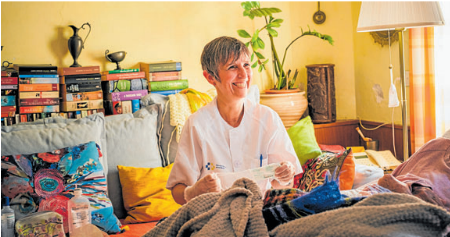
Imagen de archivo de una enfermera rural realizando una visita a domicilio en Gran Canaria.