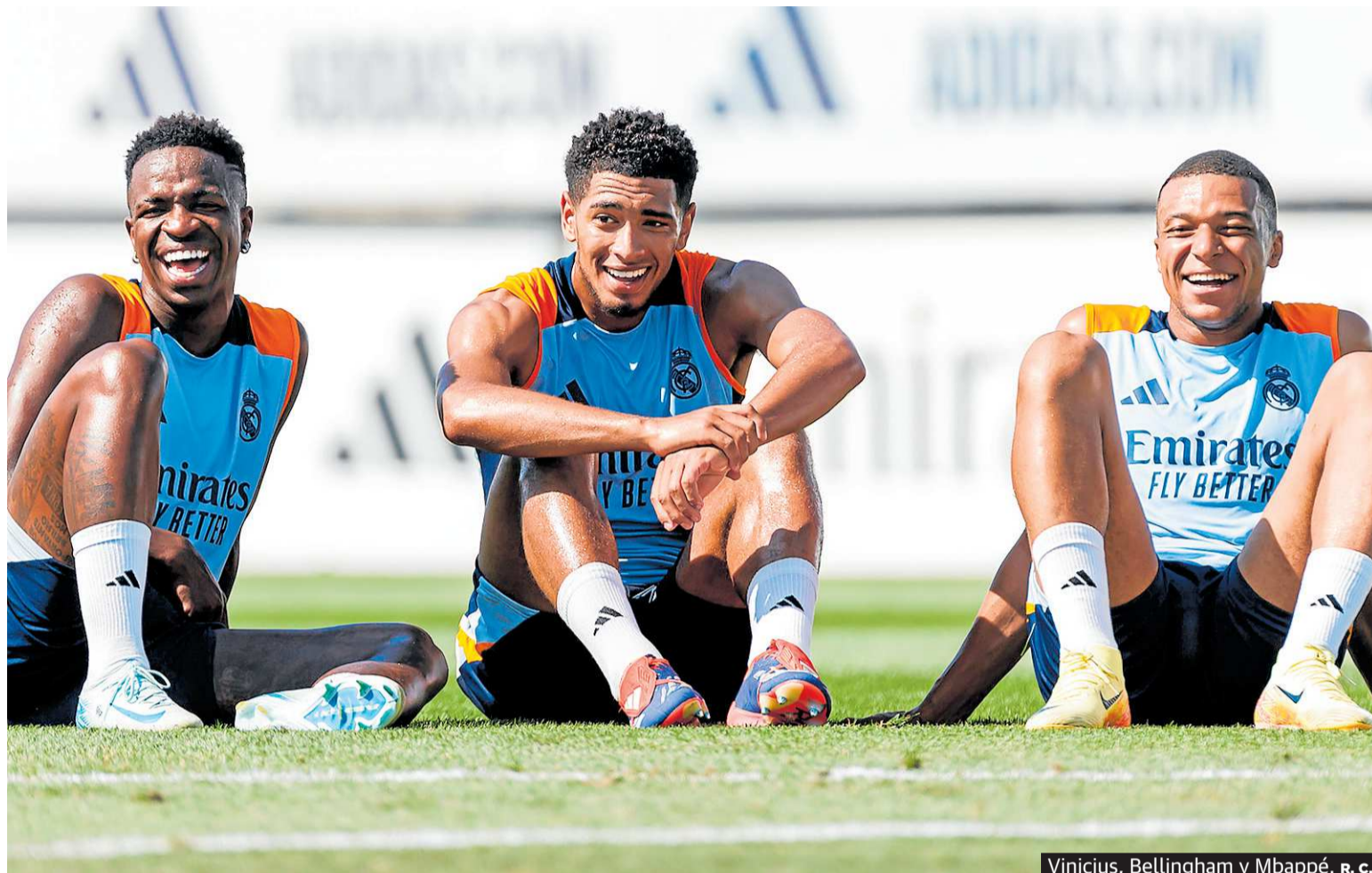
Vinicius, Bellingham y Mbappé.

Favorito. Los fichajes de Mbappé y de Endrick incrementan el potencial ofensivo del Real Madrid, cuya principal incógnita radica en el rendimiento del centro del campo sin Kroos