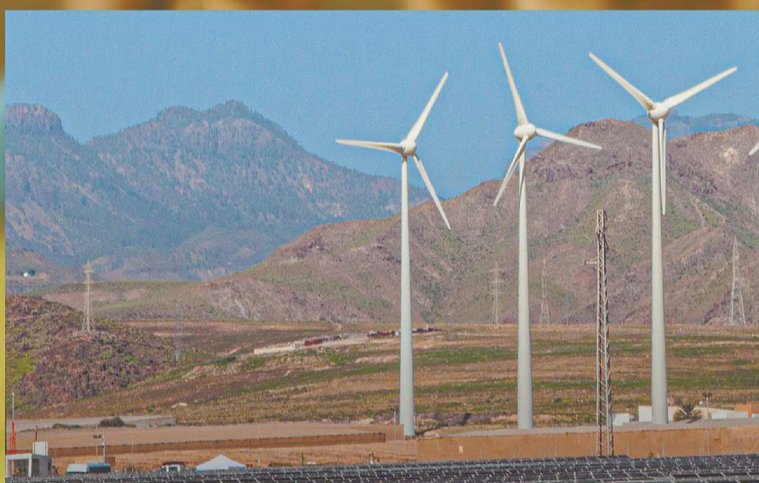
Complejo de energías renovables Ecoener, en Gran Canaria.