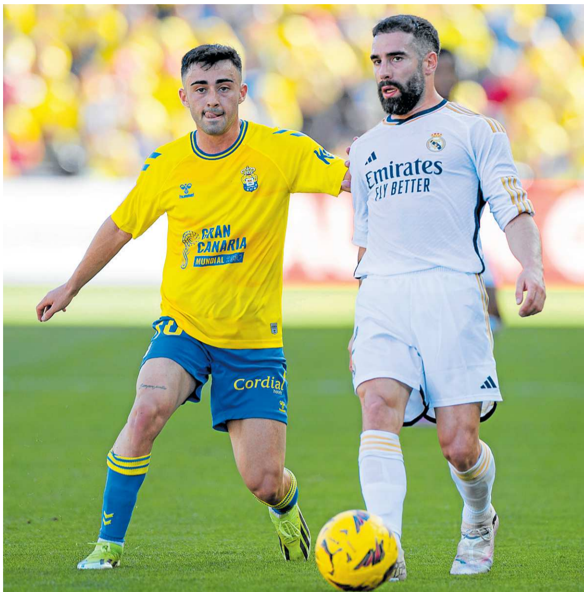
Esta temporada se escribirá un episodio más de los duelos ante el Real Madrid. c7

Por contra, el oponente que peor se le ha dado a la UD en la máxima categoría es, con dife-