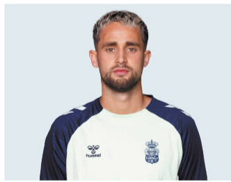
27 Adnan Januzaj

El futbolista procedente del Albacete ha mostrado su calidad con el balón, además de sus disparos a puerta. Ya con el equipo manchego marcó varios goles la temporada pasada en Segunda División. Quiere debutar en la élite de la mejor manera.