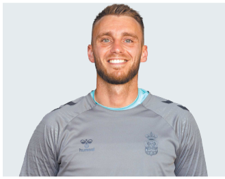
1 Jasper Cillessen

Portero 35 años Experiencia y galones para la meta