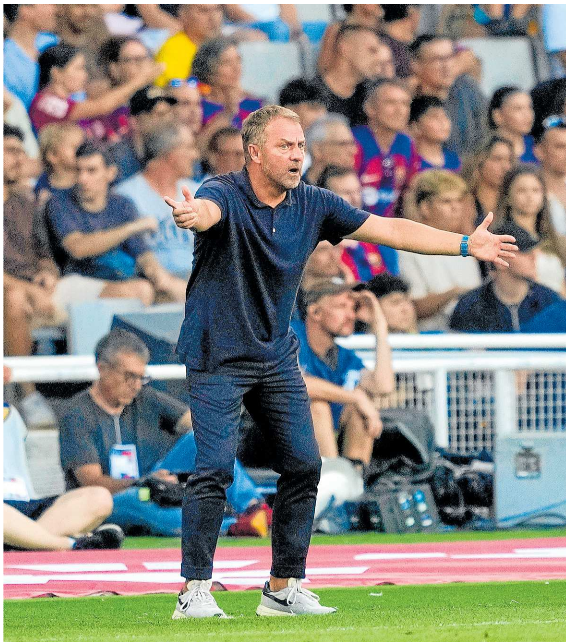
Hansi Flick, durante el trofeo Joan Gamper disputado el lunes entre el Barça y el Mónaco en Montjuic.

Todos esos jugones estarán al servicio de un tridente ofensivo que está condicionado a la llegada en lo que queda de agosto de un extremo en el perfil zurdo. El club azulgrana no tiene prisa, sabedor de que tiene en la plantilla a Ferran Torres, Ansu Fati, Vi-