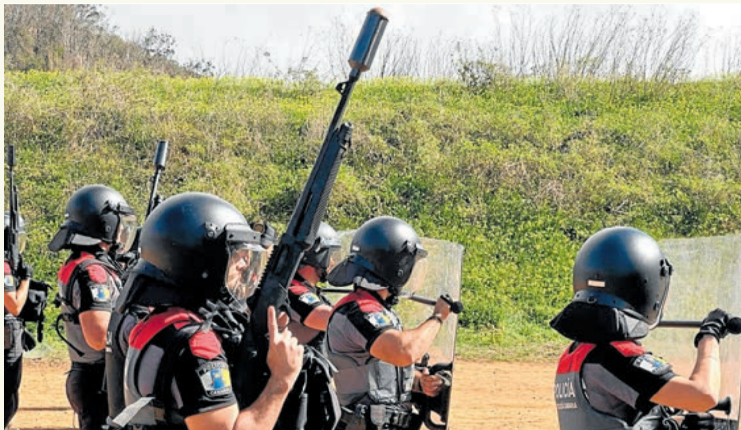
▲ Se elimina la complejidad y se sustituye por superar unas determinadas pruebas físicas. c7